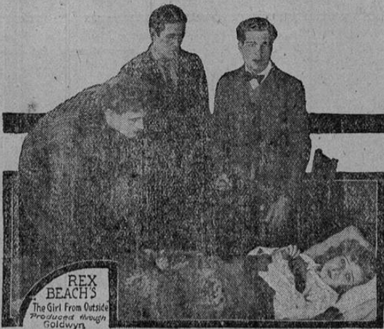
LOS CINCO TUNANTES

La película que se estrena esta noche en el Teatro Moderno se llama LOS CINCO TUNANTES, y es realmente la historia de cinco hombres que viven en la libertad del campo dedicados más bien al mal que al bien.